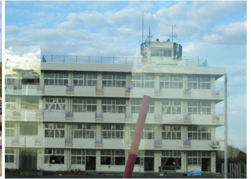
津波の爪痕が残る関上中学校