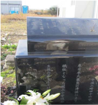
関上中学校遺族会建立の慰霊碑