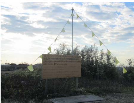
地域再建運動の象徴 黄色いハンカチ