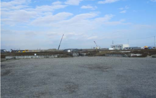
まわりは見渡す限りの更地