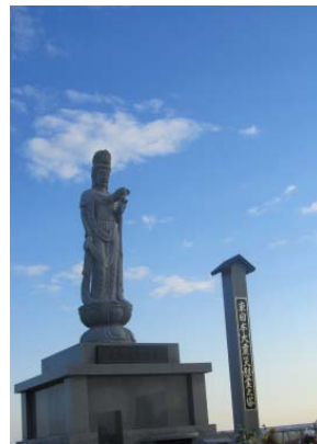
犠牲者を弔う 東日本大震災慰霊之塔と荒浜慈聖観音